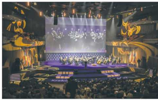
Europejski Kongres Samorządów przyciągnął w ubiegłym roku 1660 gości z kraju i zagranicy

– Rząd coraz częściej przerzuca na polskie samorzady zadania w wielu strefach – podkreśla też Arkadiusz Wiśniewski, prezydenta Opola. – Za chwilę nie będą one w