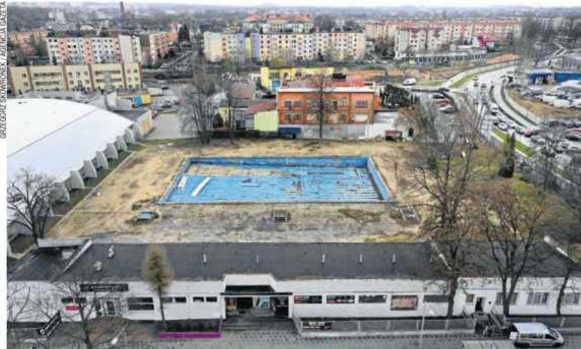
Basen został zamknięty jesienią 2010 roku

Jednocześnie Marszałek poinformował radnego, że w ubiegłym