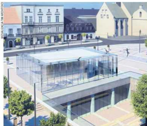
Tak ma wyglądać szklany pawilon, który stanie na Starym Rynku. Więcej wizualizacji: czestochowa.wyborcza.pl