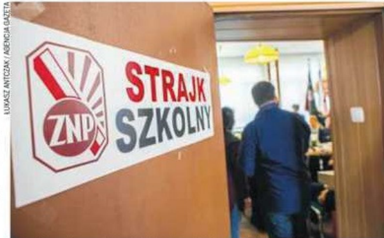
W referendum wzięło udział w Częstochowie 4367 osób

Do strajku przyłączają się także pracownicy wszystkich szkół specjalnych w Częstochowie: Zespołu Szkół Specjalnych (nr 23, 28 i 45), Ze-