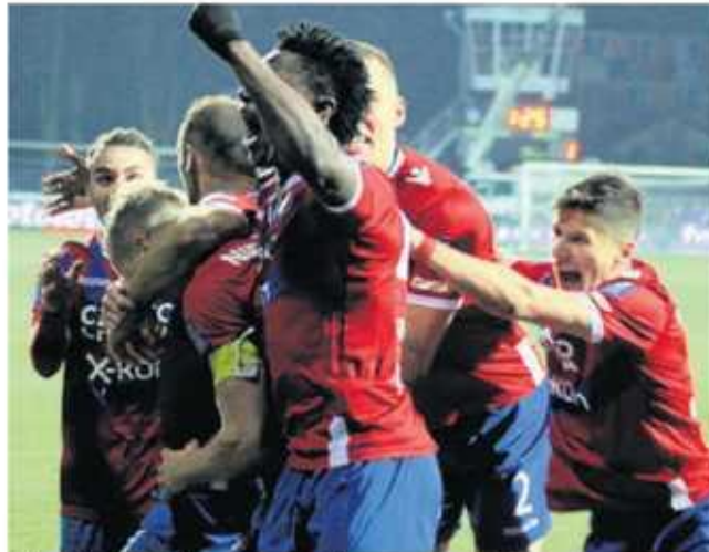
Tak piłkarze Rakowa Częstochowa cieszyli się z wygranej nad Legią, a kiedy zagrają na nowym stadionie?

Pozostałe dwie oferty nie przekraczały 400 tysięcy zł.