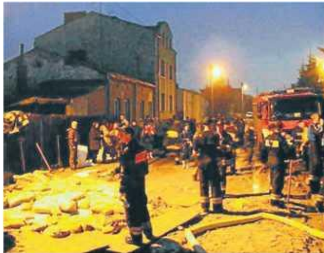
Częstochowa przeżyła bardzo niebezpieczne dni podczas powodzi w 2010 roku. Woda zalała znaczną część miasta

- Inwestycja w rejonie ulic Lawendowej, Hiacyntowej i św. Brata Alberta zostanie zrealizowana w ramach programów „Lepsza Komunikacja w Częstochowie” i „Kierunek - przyjazna Częstochowa”, bo dzięki zagospodarowaniu tego terenu będzie bezpieczniej i wygodniej dla tych, którzy mieszkają w tej