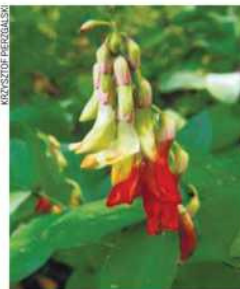
Groszek wschodniokarpacki, który występuje na terenie Gąszczyka

Częstochowscy przyrodnicy i inne środowiska popierające inicjatywę, m.in. architekci, nie poddali się. Pod koniec roku 2018 złożyli do RDOŚ dokumenty i mapy uzasadniające – mimo ochrony sieci „naturowej” – potrzebę powołania rezerwatu. Przekonywali, że powinni mieć powierzchnię blisko 29 hektarów, a jego otulina ponad 31 hektarów. Miał-