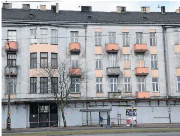
Dom Księcia zabezpieczono przed dalszą degradacją techniczną