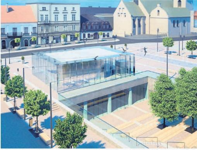
Głównym elementem odnowionego Starego Rynku w Częstochowie będzie szklany pawilon