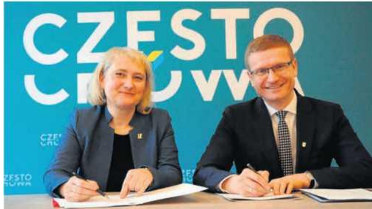
Podpisanie porozumień odbyło się pod koniec 2018 roku w Urzędzie Miasta w Częstochowie