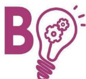
V edycja Budżetu Obywatelskiego w Częstochowie

Dwanaście zadań ogólnomiejskich i 111 dzielnicowych zostanie zrealizowanych w przyszłym roku, w ramach V edycji Budżetu Obywatelskiego w Częstochowie. Zdecydowało o tym ponad 20 tys. mieszkańców.