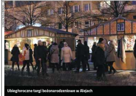
Ubiegłoroczne targi bożonarodzeniowe w Alejach

- Tradycyjnie zakupić będzie można wszystko, co tylko może być potrzebne na święta: choinki, stroiki, jemioly, ozdoby i bombki. Prezenty przeróżne, a także wszelakie