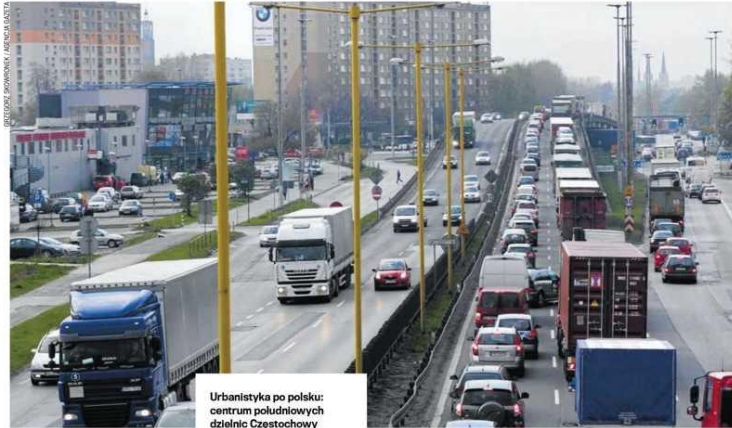
Urbanistyka po polsku: centrum południowych dzielnic Częstochowy