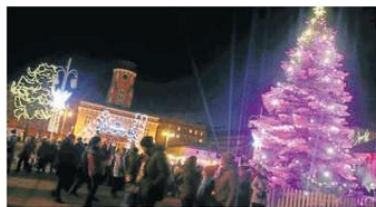
W plebiscycie z miast naszego województwa rywalizuje na ratyko Częstochowa. Ale inne miasta też mogą się jeszcze zgłaszać

ować, bo zwycięska miejscowość otrzyma energooszczędny sprzęt AGD dla najbardziej potrzebujących mieszkańców regionu.