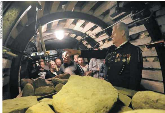
Muzeum Górnictwa Rud Żelaza jest jednym z najchętniej odwiedzanych takich obiektów w Częstochowie. Znajduje się na Szlaku Zabytków Techniki Województwa Śląskiego, stąd co roku odbywa się tu też Industriada

Pod koniec lat 70. XX w. postanowiono przenieść na muzeum jedną z likwidowanych kopalń - „Szczekaczka” w gminie Poczesna. Zabytkowy obiekt otwarto tu 3 grudnia 1980