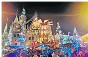
W konkursie fotograficznym startuje m.in. Anna Srebro z Katowic. Swoje prace można zgłaszać do 18 stycznia

Głosuj na swoje miasto, a jeśli nie ma go w plebiscycie, zgłoś je do zabawy. Warto się zaangażować