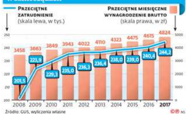
Jak rosną zatrudnienie i wynagrodzenie w samorządach

Taki bonus jest związany z odejściem ze stanowiska, a w wielu przypadkach wodarze – zwłaszcza największych miast – utrzymali swoje funkcje. Tymczasem w przypadku ponownego wyboru na stanowisko odprawy pieniężne i ekwiwalenty za niewykorzystany urlop wypoczynkowy nie są wypłacane, ponieważ traktuje się to jako ciągłość zatrudnienia.