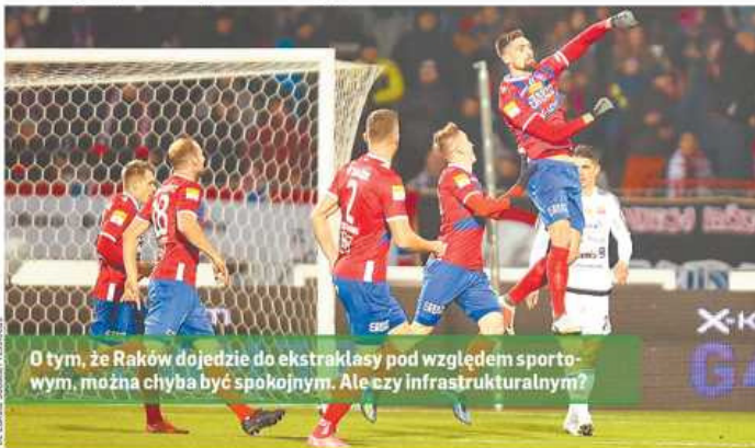
O tym, że Raków dojedzie do ekstraklasy pod względem sportowym, można chyba być spokojnym. Ale czy infrastrukturalnym?