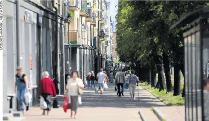
- Raków ma szczególny koloryt, odmienny od reszty Częstochowy - przekonują organizatorzy wystawy