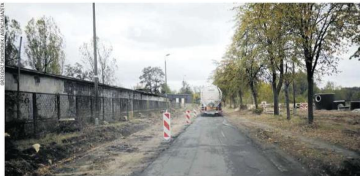
Ruch wahałdowy na remontowanej ul. Korfantego

Aby usprawnić prace, Miejski Zarząd Dróg i Transportu chciał całkowicie zamknąć ul. Korfantego od ronda Szwejkowskiego do nowej drogi łączącej ul. Bojemskiego z Korfantego (przy tej ulicy mieści się x-kom) i wyznaczyć objazd przez Bojem-