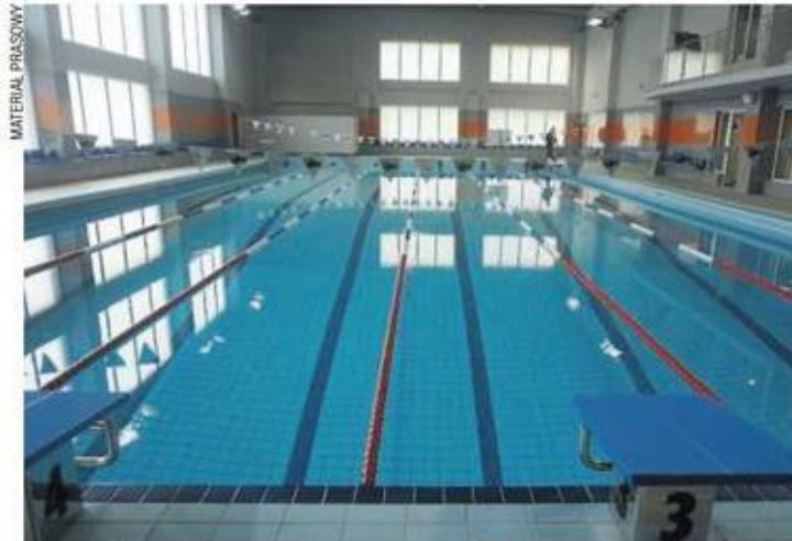
Remont basenu został dofinansowany z funduszy europejskich

Dzięki inwestycji utrzymanie pływalni ma być tańsze i ekologiczne. - Modernizacja pływalni jest świet-