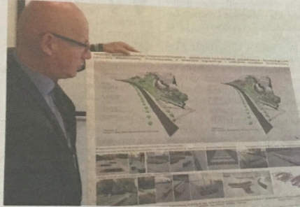
Wizualizacja Promenady Śródmiejskiej.

Promenada Śródmiejska ma powstać na terenie dawnego Węglobloku (pomiędzy ulicami Skłodowskiej-Curie, Boya-Zeleńskiego, Aleją Wolności, Aleją Bohaterów Monte Cassino). Ze względu na lokalizację i potencjał miejsca, ten punkt może stać się idealnym miejscem wypoczynku dla Częstochowian. Mieszkańcy dzielnicy Trzech Wieszców już kilka lat temu podjęli starania o utworzenie