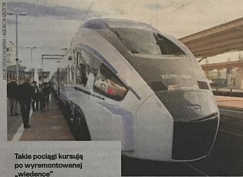
Takie pociągi kursują po wyremontowanej „wiedence”

W dzielnicy Kiedrzyńska inwestycja obejmuje m.in. budowę otwartego rowu, zbiornika chłonnego - odprowadzającego deszcz, otwartego i zamkniętego. Zostaną także przebudowane wodociąg, ka-