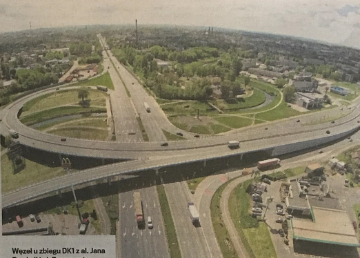
Węzeł u zbiegu DK1 z al. Jana Pawła II i ul. Drogowców

Budowa obwodnicy autostradowej Częstochowy oraz nowej dwupasmówki do Łódzka w Pyrzowicach - skład można pojechać dalej w stronę Gliwic i czeskiej Ostrawy bądź SI w kierunku „gierkówki” i wschodniej obwodnicy GOP-u - to najbardziej oczekiwana inwestycja komunikacyjna w regionie częstochowskim. Całość ma być gotowa pod koniec 2019 r. Autostrada będzie liczyć 58,5 km i posiadać pięć węzłów (nie licząc istniejącego w Pyrzowicach). Częstochowa Piłnosc, Częstochowa Jama Góra na przebiegu z drogą krajową nr 43 do Kłobucka, Częstochowa Bia-