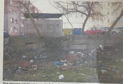
Tak jeszcze niedawno wyglądała niezagospodarowana działka.

elementów jego zagospodarowania. Przed rozpoczęciem właściwych prac konieczna jest rozbiorcza dwóch budynków gospodarczych, ogrodzeń oraz pozostałości zabudowy. Zdemontowane zostaną schody terenowe, nieczynny maszt oświetleniowy i odcinek nieczynnego kanału sanitarnego. Trzeba usunąć istniejące nawierzchnie z umieszczonymi w nich elementami różnej infrastruktury. Głównym założeniem w pierwszym etapie inwestycji będzie aleja dla pieszych, biegnąca w osi wschód-zachód przez cały teren objęty zagospodarowaniem. Aleja połączy plac wejściowy z placem centralnym - wielofunkcyjnym placem sportowym z urządzeniami do ćwiczeń sprawnościowych typu street workout.