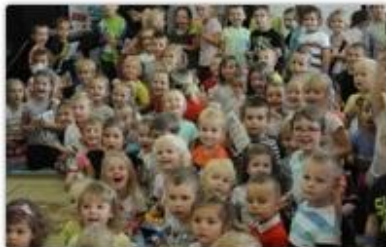
fof. UM Częstochowy

Przedszkolaków z Miejskiego Przedszkola nr 20 im. Króla Macjusia Pierwszego odwiedzili w środę, 17 października częstochowscy policjanci, którzy wręczyli im odblaskowe opaski. Spotkanie zainaugurowało akcję „Odblaski ratują życie”.