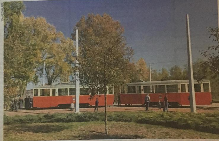
Pierwszy kurs składu „enek”.