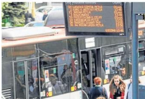
Elektroniczne tablice informacyjne stają się nieodłącznym elementem systemu informacji w wielu miastach

W ramach projektu zostanie zakupionych 1000 pilotów, które zostaną przekazane osobom niedowidzącym i niewidomym, które są mieszkańcami Częstochowy. ©