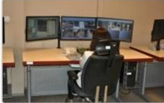
fol. UM Częstochowy

Miejski monitoring w Częstochowie obsługiwany jest już przez ponad 80 kamer. Wkrótce zaczną działać kolejne.