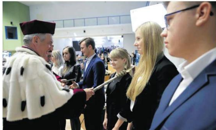
GRZEGORZ SKOWRONIENI, AGENCJA DANEZA