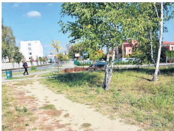
Teren po „Węglobloku” trochę uporządkowano, ale to nie jest ładny skwer