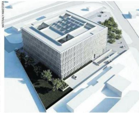
Tak ma wyglądać gmach sądu przy ul. św. Rocha 80/90

Dyrekcji Sądu Okręgowego w Częstochowie udało się przekonać resort sprawiedliwości do dołożenia pieniędzy. 17 września została podpisana umowa z Przemysłówką na realizację zadania pod nazwą „Budowa budynku dla potrzeb Sądu Rejonowego Częstochowa-Północ przy ul. św. Rocha 80/90” za oferowaną w przetargu kwotę.