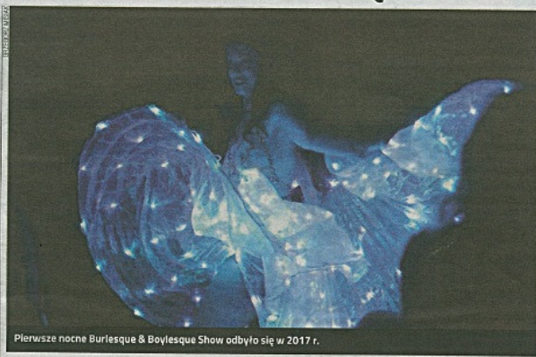
Pierwsze nocne Burlesque & Boylesque Show odbyło się w 2017 r.

Aby zacerpanąć powietrze, spacerkiem przeszliśmy do Regionalnego Ośrodka Kultury na taperkę Kabil Hole, która na Noc przejdzie prosto z Łodzi. Wracając do ścisłego centrum na koncert Hadesa, pewnie na-