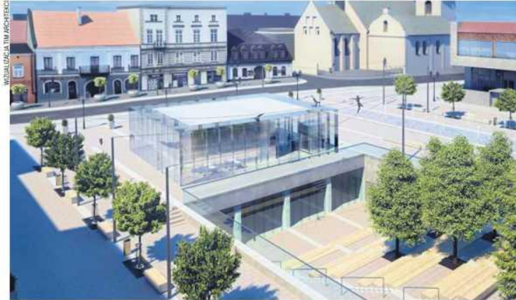
Tak ma wyglądać Stary Rynek po rewitalizacji

O rewitalizacji Starego Rynku w Częstochowie zaczęło się mówić już pięć lat temu, w poprzedniej kadencji samorządu. Dwaj ówczesni radni: Jerzy Zajac i Zbigniew Niesmaczny ponadpartyjnie i ponad podziałami zasugerowali, że najwyższy czas, by się Częstochowa zaczęła chwalić Jerzym Kędziorą, znanym w kraju i na świecie twórcą rzeźb balansujących. I że Stary Rynek świetnie by się nadał na plenerowe muzeum jego dzieł. Pomysł ewoluował i powstała idea, by rzeźby Kędziory stały się elementem odnowionego Starego Rynku. Zwłaszcza że w tzw. międzyczasie archeolodzy od-