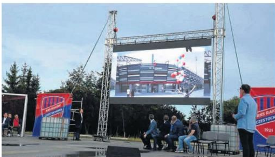
Wizualizacja zmodernizowanego stadionu podczas prezentacji drużyny na sezon 2018/2019

W Niecieczy udało się przeprowadzić modernizację w nieco ponad 4 miesiące. W Częstochowie to opcja mało prawdop