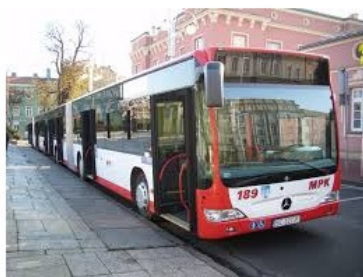
Autobus częstochowskiego MPK

Krzysztof Matyjaszczyk walczy o reelekcję w częstochowskim ratuszu. Jedną z jego decyzji budzi uznanie z prospołecznej perspektywy. Od 1 września uczniowie częstochowskich szkół ponadgimnazjalnych będą mogli podróżować za darmo komunikacją miejską.