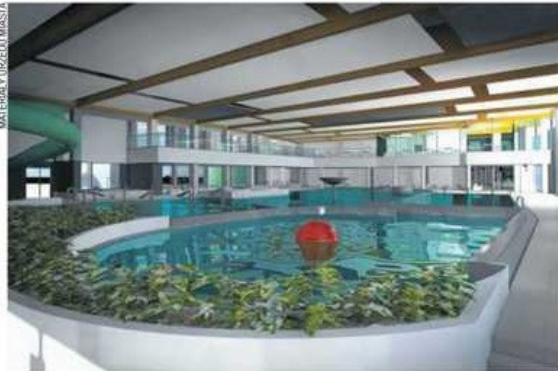
Wizualizacja wnętrza parku wodnego

W aquaparku znajdzie się kilka niecek basenowych, w tym jedna ze sztuczną falą, trzy zjeżdżalnie - dwie rurowe i jedna otwarta, strefa saun czy też hydromasaże. Nie można wykluczyć, że w przyszłości obiekt się powiększy. - Projektanci zapewniali nas, że jeśli zajdzie taka potrzeba, to możliwa będzie rozbudowa - mówi Marszałek. ◉