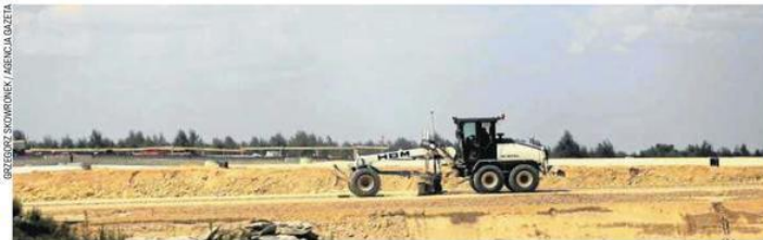
Budowa autostradowej obwodnicy Częstochowy

Generalny wykonawca odcinka „F” autostrady Częstochowa - Pyrzowice długo się bronił przed rozbiórką. Włoska firma Salini poza badaniami komisijnymi wykonanymi w laboratorium Generalnej Dyrekcji Dróg Krajowych i Autostrad, przedstawiała szereg opracowań i ekspertyz. Dokumenty powstały m.in. na Politechnice Krakowskiej i w Akademii Górniczo-Hutniczej. GDDKiA otrzymała też wyniki sta-