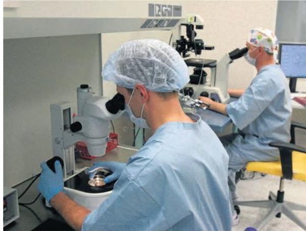
Miejski program in vitro w Częstochowie ma być kontynuowany co najmniej do 2020 roku