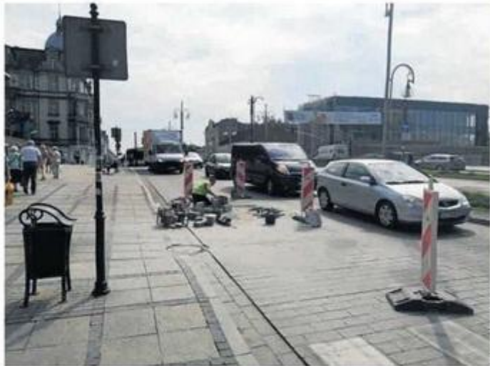
Drogowcy poprawiają kostkę granitową w jezdni w II alei Najświętszej Maryli Panny