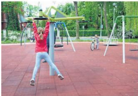
Mieszkańcy zgłaszają budowę nowych placów zabaw i placu rekreacji ruchowej, ale chcą również uczyć się języków