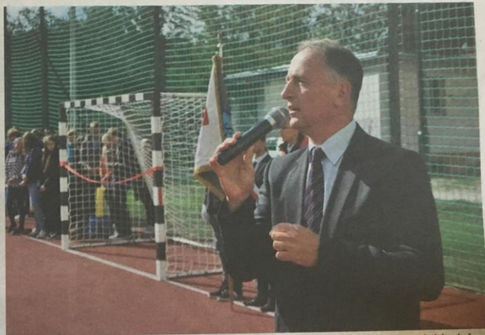
Wiceprezydent Częstochowy Jarosław Marszałek na otwarciu jednego z boisk szkolnych

Przebudowywane będą też sanitariaty - w SP nr 31 przy ul. PCK, nr 50 przy ul. Starzyńskiego i w Miejskim Przedszkolu nr 36 przy ul. Kukuczki. W Szkole Podstawowej nr 2 przy ul. Baczyńskiego wyremontowane będzie zaplecze basenu (szatnie i sanitariaty), posadzki w Miejskim Przedszkolu nr 6 przy ul. Sosnowej, a w Specjal-