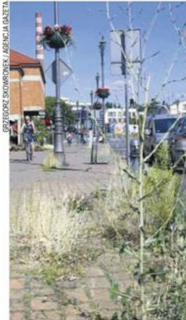
Chwasty na ul. Mirowskiej

Mieszkam przy ulicy Mirowskiej przy światłach z Nadrzeczną. Chciałabym poruszyć taki problem: mamy chodnik wyłożony kostką, słupki ograniczające wjazd samochodów i latarnie, na których zawieszono znów donice z pięknymi kwiatami. A na dole między kostkami bujnie rosnące chwasty, te płożące (na których zatrzymują się śmieci) i wysokie trawy jak marne zboża z kłosami. Nowoczesność i niechlujstwo. Tylu turystów i pielgrzymów przyjeżdża do naszego miasta - jest mi naprawdę wstyd. Chyba dwa lata temu pracownik koszący trawy nad Wartą próbował te chwasty wokół latarni i słupków skosić, ale kosiarka się zacięła. W urzędzie miasta jest chyba ktoś odpowiedzialny za estetykę miasta? Urząd miasta pewnie odpowie, że nie mają już pieniędzy, ale przecież można zatrudnić więźniów lub uszczknąć trochę z budżetu oby-