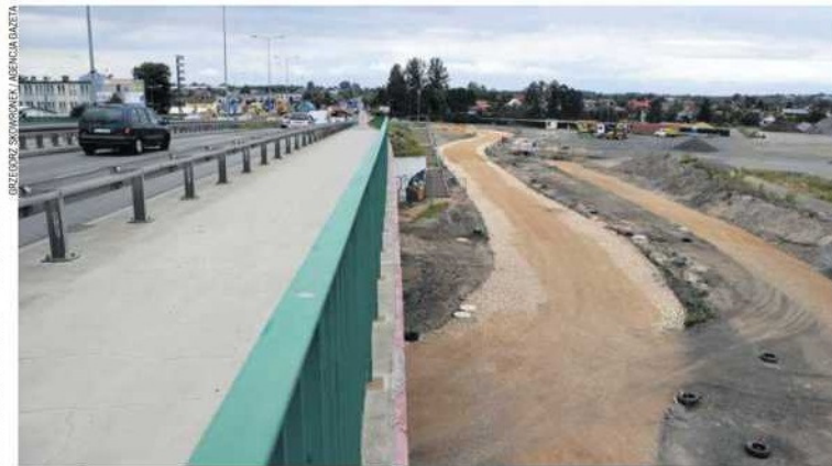
Prace przy budowie ślimaka potrwać maksymalnie do końca października

Sama inwestycja jest potrzebna. Od czasu wybudowania wiaduktu nad torami, którym biegnie ul. Jagiellońska, wjazd na nią z ul. Bór (od strony Wypalanki) stał się dość skom-