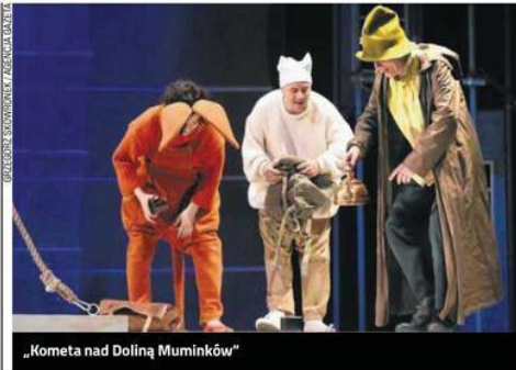
„Kometa nad Doliną Muminków”