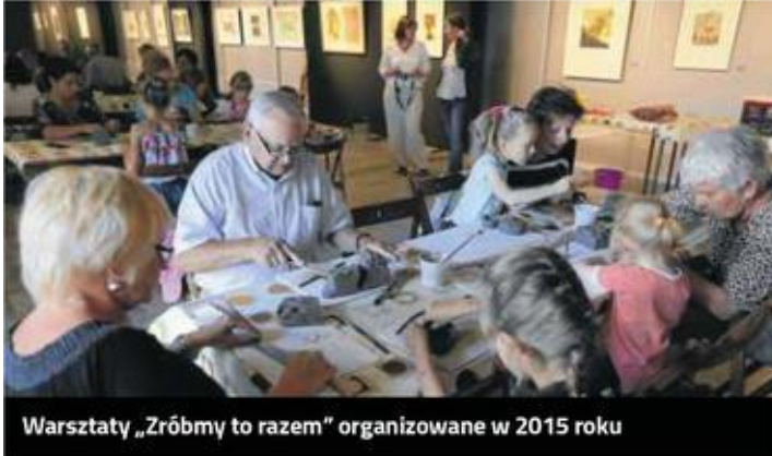
Warsztaty „Zróbmy to razem” organizowane w 2015 roku