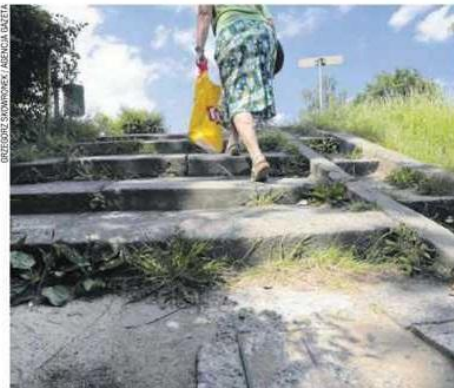
Zniszczone schody na końcu ul. Kilińskiego, tuż obok szpitala przy ul. POK