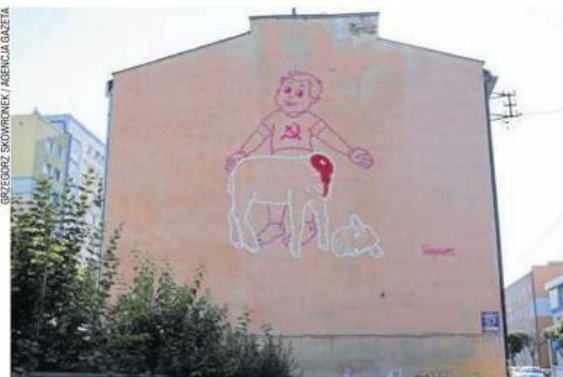
Mural na kamienicy przy ul. Kopernika powstał latem 2016 r. To dzieło Simpsona, warszawskiego twórcy, który w swoich pracach chętnie komentuje sytuację polityczną i społeczną, nie tylko w Polsce

Już dwie godziny po odsłonięciu muralu do właścicieli kamienicy zawital policjant z położonego naprze-