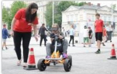
fol. UM Częstochowy

W poniedziałek, 18 czerwca na placu Biegańskiego odbędzie się kolejna edycja Częstochowskich Dni Profilaktyki.