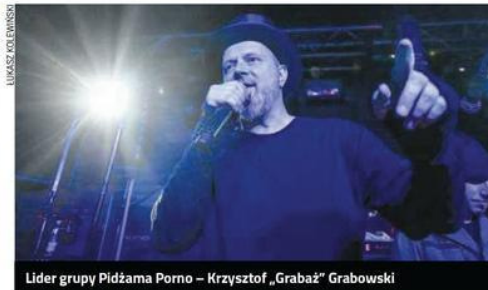
Lider grupy Pidżama Porno – Krzysztof „Grabaż” Grabowski