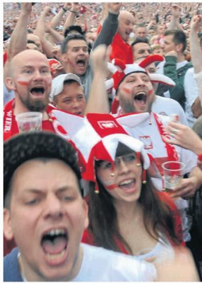
Polscy kibice liczą na sukces reprezentacji na mundialu w Rosji