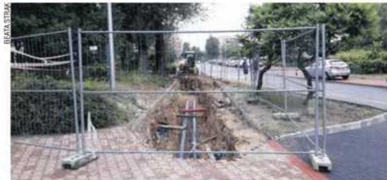
Rozkopany fragment chodnika na ul. Okólnej

Tymczasem kilka dni temu fragment świeżo ułożonego z kostki chodnika został rozebrany i wykopano ogromną dziurę. - Robotnicy zaczęli układać jakieś rury - relacjonuje czytelnik „Wyborczej”.