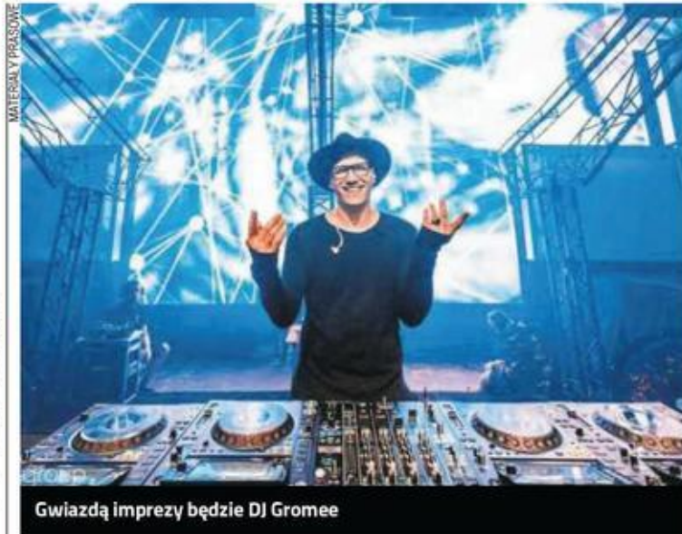
Gwiazdą imprezy będzie DJ Gromee

Atrakcje sobotniej odsłony imprezy rozpoczyna się już w południe. Nie brakuje propozycji sportowych, takich jak wyścigi gokartów czy bieg w workach. Potem przed częstochowską publicznością zaprezentują się choćby Last Road (godz. 17.30), Two Hops (godz. 18) czy Black Pearls (godz. 19.30).