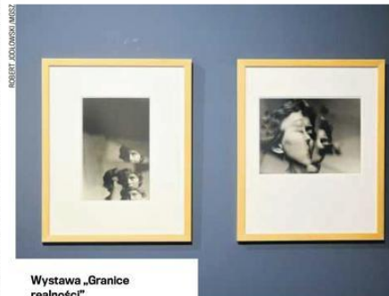
Wystawa „Granice rzeczywistości”

wa. I nie będzie, bo „Granice rzeczywistości” nie zawiodą żadnego wielbiciela talentu mistrza. Czeka bowiem 100 fotografii, 30 rysunków i 25 obrazów. Sercem wystawy jest fotograficzny zbiór użyczony przez Nowohuckie Centrum Kultury.