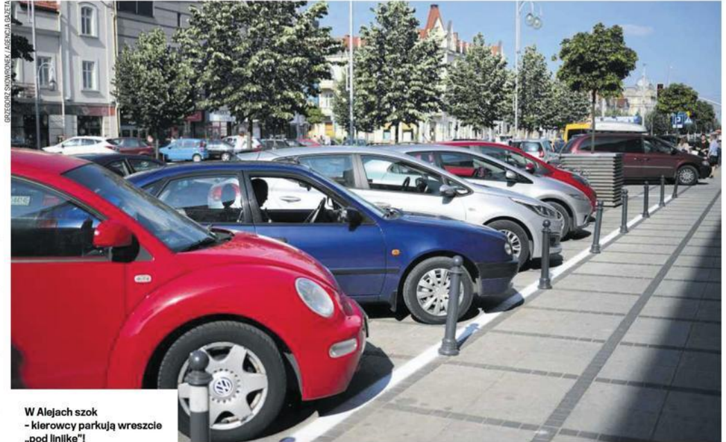
W Alejach szok – kierowcy parkują wreszcie „pod linijkę”!

Na początku 2016 r. sprawa trafiła do prokuratury, śledczy jednak nie dopatrzyli się przestępstwa.