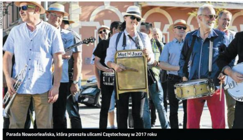
Parada Nowoorleańska, która przeszła ulicami Częstochowy w 2017 roku