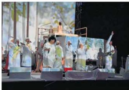
O życiu i twórczości Haliny Poświatowskiej artyści opowiedzieli wykorzystując m.in. muzykę, taniec i wiersze poetki