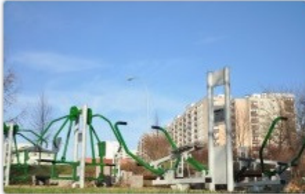
fol. UM Częstochowy

Jesienią tego roku w dzielnicy Wyczerpy-Aniołów powstanie skatepark, parkour oraz tzw. streetworkout będzie można uprawiać na placu przy alei Kościuszki, a dwa kolejne place rekreacji pojawią się przy ulicach Warszawskiej i Kuncewiczowej.