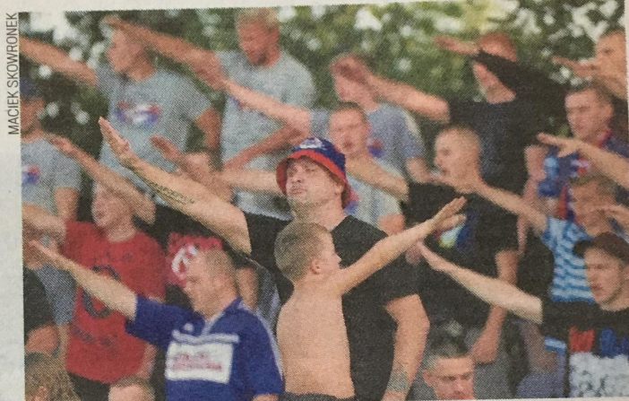
Kibice Rakowa podczas meczu ze Stalą Mielec 9 września 2017 r.

Po raz pierwszy takie warunki, nowatorskie w skali kraju, miasto wprowadziło w ub. roku do umowy z Rakowem. Nie był to martwy przepis, o czym działacze klubu dotkliwie przekonali się po meczu w Chorzowie, gdzie częstochowscy kibole zdemolowali stadion. Kara została wyegzekwowana (120 proc. dotacji) - mimo nacisków polityków różnej opcji, że władze Rakowa nie odpowiadają za za-