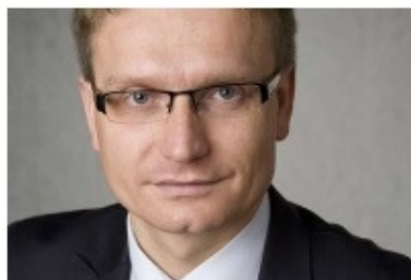
Krzysztof Matyjaszczyk, prezydent Częstochowy

Częstochowa rozbudowuje infrastrukturę drogową. Inwestycja potrzebna jest firmom budującym i planującym swoje zakłady na terenach Katowickiej Specjalnej Strefy Ekonomicznej w lokalizacji Skorki. Droga kosztować będzie miasto 8,8 mln zł. Nakłady zrealizowane lub zadeklarowane do tej pory przez inwestorów na Skorkach to już obecnie ponad 136 mln zł.