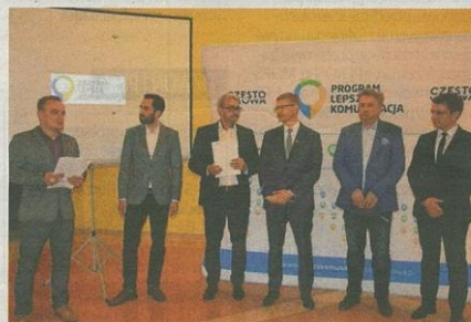
Władze miasta i MPK pochwały się nowymi propozycjami udogodnień dla pasażerów komunikacji miejskiej

Częstochowianie mogą już też korzystać z systemu doładowań na urządzenia przenośne, czyli tzw. bilet na smartfona. Umożliwia zakup on-line biletów na smartfony oraz sprawne kontrolowanie ich ważności. Na stronie internetowej https://zbiletem.pl/?hash=czestochowa należy wybrać rodzaj biletu (okresowy, jednorazowy, ulgowy itp.), wpisać niezbędne dane, zapłacić przelewem lub kartą oraz zainstalować aplikację na dowolnym smartfonie z systemem Android, iOS lub Windows Phone. Bilet w aplikacji okazuje się kontrolerowi. Jeśli w tym momencie smartfon odmówiłby współpracy - np. padłaby bateria - wystarczy pokazać dokument z numerem PESEL. ©