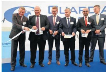
Budowę nowej huty Guardian w Częstochowie oficjalnie rozpoczęto jesienią ubiegłego roku

- Nie ma mowy o przerzucaniu łopata. Chodzi o obsługę komputerów i urządzeń - wyjaśnił dyrektor huty. ©©