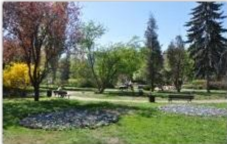
fol. UM Częstochowy

Częstochowa powierzyła pielęgnację zieleni miejskiej specjalistycznym firmom. Ma wpływać to na lepszą efektywność i ułatwić nadzór nad realizacją „zielonych” zadań. Na ich realizację miasto przeznacza w tym roku 4,7 mln zł.