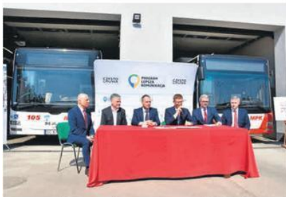
Umowę podpisano przed wyremontowaną halą autobusową. Nowe pojazdy przyjadą w październiku i w listopadzie