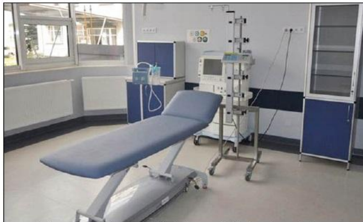
W nowo wybudowanej części znalazły się nowe 23 łóżka, dzięki czemu oddział będzie mógł przyjąć dwukrotnie więcej pacjentów niż do tej pory.

Oddział został wyposażony w nowoczesny sprzęt, m.in. kardiomonitory, respirator stacjonarny, respiratory transportowe, pompy infuzyjne dwutorowe, zestawy do intubacji, defibrylator, defibrylator przenośny, defibrylator z kardiodiagnosą, pulsoksymetry przenośne, stoly zabiegowe, aparat do