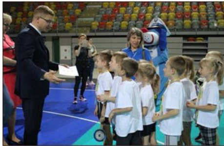
towych oraz aktywizacji dzieci. Wśród konkurencji, jakie cze-

Podobnie, jak podczas poprzednich edycji, maluchy z 17 przedszkoli rywalizowały w różnych sportowych konkurencjach grupowych, dostosowanych do ich możliwości i potrzeb rozwojowych. Całość służyła promocji aktywności ruchowej jako zdrowych i bezpiecznych form spędzania wolnego czasu, tworzeniu atmosfery współpracy, rozwijaniu odporności emocjonalnej, wdrażaniu do przestrzegania reguł zawodów spor-