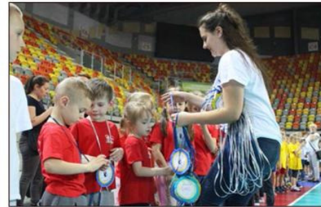
Głównym organizatorem ogólnomiejscowej imprezy był Zespół Szkolno-Przedszkolny nr 3.

Po rozegraniu wszystkich konkurencji komisja konkursowa podliczyła punkty i ogłosiła zwycięzców. Najlepszymi okazali się reprezentanci Miejskiego Przedszkola nr 9, drugie miejsce zdobyło Miejskie Przedszkole 41, a trzecie MP5. Wszystkim pozostałym przedszkolom przyznano miejsce czwarte. Oprócz nagród i medali, przedszkolaki otrzymały również dyplomy i słodkie upominki od prezenta Krzysztofa Matyjaszczyka.