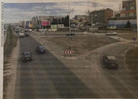
Mniejsza inwestycją była - zakończona w ostatnich dniach - budowa pasa włączeniowego z ul. Wilsona w al. Jana Pawła II

Nie ogranicza się ona jedynie do wymiany nawierzchni na ul. Głów-