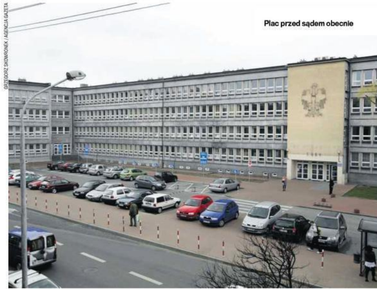
Plac przed sądem obecnie

Pod koniec 2015 r. do prezydenta miasta wpłynął list podpisany przez grupę mieszkańców śródmieścia, w którym sprzeciwili się zamianie „eleganckiego z założenia centrum w niekończący się parking”