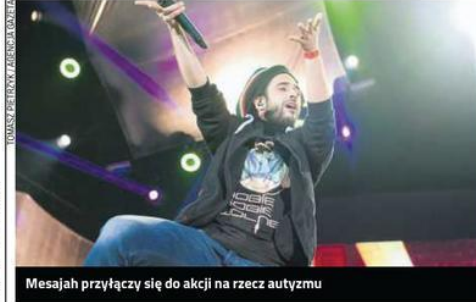
Mesajah przyłączy się do akcji na rzecz autyzmu

Stowarzyszenie na rzecz Osób Niepełnosprawnych z Autyzmem i Zaburzeniami Pokrewnymi „Daj Mi Czas” działa w Częstochowie od 2007 roku. Powstało z inicjatywy nauczycieli Zespołu Szkół Specjalnych nr 23 i rodziców uczniów uczęszczających do tej placówki. Do ogólnoswiatowej akcji rozświetlania świata na niebiesko (zainicjowanej przez amerykańską organizację Autism Speaks) stowarzyszenie włączyło się w 2012 r. W tym właśnie roku ponad 2 tys. budynków w 180 miastach w 48 krajach - w ramach gestu solidarności z osobami z autyzmem - zmieniło kolor na niebieski. Wśród nich m.in. Pałac Kul-