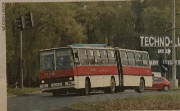
Najstarszy w Polsce Ikarus, rocznik 1982, w barwach MPK Częstochowa

Węgierskie przegubowce ustąpiły miejsca krótkim pojazdom, napędzanym gazem CNG. To już kolejny zakup tego typu z tzw. drugiej ręki. W ub.r. MPK sprowadziło kilka używanych mercedesów, pojazdy się sprawdziły, więc kupowane są kolejne. - W 2017