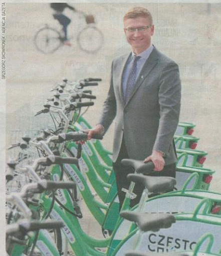
Prezydent Krzysztof Matyjaszczyk przy stacji dokującej

Czy uruchomienie rowerów miejskich oznacza jakąś większą zmianę w polityce transportowej miasta, odejście od ruchu samochodowego na rzecz bardziej zrównoważonego transportu? - W ramach naszego programu „Lepsza Komunikacja” stawiamy na rozbudowę infrastruktury