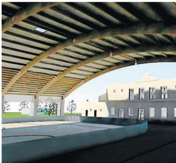
Tak na wizualizacjach prezentuje się zadaszenie lodowiska przy ulicy Boya-Zeleńskiego

Dach znajdzie się na wysokości ponad 11 metrów, a jego powierzchnia wyniesie ponad 3 tys. metrów kw. Zadanie będzie miało formę łukową i zostało tak zaprojektowane, aby osłaniało przejście z budynku MOSiR na płytę lodowiska oraz pozostałe obiekty sportowe. Od strony trybuny projektowane są rolety, które osłonią widownię przed wiatrem, a jednocześnie umożliwią przewietrzanie obiektu nocą, kiedy nie będzie użytkowany. Oprócz budowy samego zadaszenia na fundamentach na palach wierconych, zakres robót obejmie też m.in. przebudowę oświetlenia płyty lodowiska i instalacji elektrycznych, przebudowę części trybuny oraz muru oporowego, ustabilizowanie skarpy trybuny oraz zagospodarowanie terenu. To pierwszy etap prac, w kolejnym planowane jest stworzenie pierwszego miejskiego zadaszonego placu zabaw.