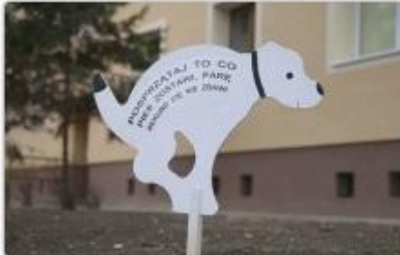
fol. ZGM TBS w Częstochowie

ZGM TBS w Częstochowie ponownie zachęca właścicieli psów do sprzątnięcia tego, co ich pupile zostawiają na trawnikach i placach zabaw podczas spacerów.