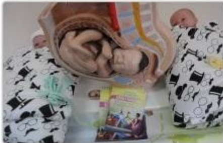
fol. UM Częstochowy

Trwa nabór do kolejnej edycji bezpłatnej szkoły rodzenia która mieści się w zakładzie rehabilitacji Miejskiego Szpitala Zespólnego przy ul. Mickiewicza 12. Mogą z niej skorzystać częstochowianki pomiędzy 21. a 26. tygodniem ciąży.