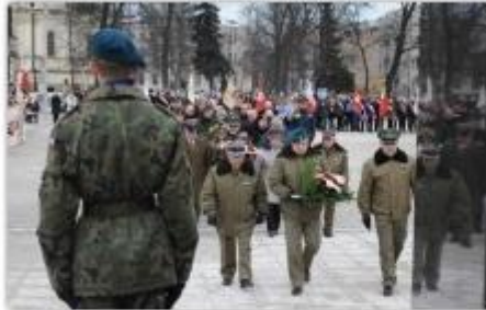
fol. UM Częstochowy

W poniedziałek, 19 marca na placu Biegańskiego odbyły się uroczystości z okazji imienin marszałka Józefa Piłsudskiego.