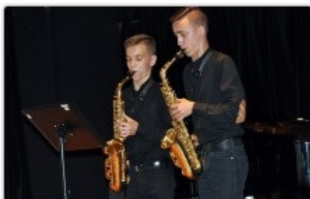
fol. UM Częstochowy

Młodzi twórcy oraz osoby zajmujące się upowszechnianiem kultury bądź opieką nad zabytkami mogą ubiegać się o stypendia artystyczne prezydenta Częstochowy. Przyznawane są one osobom, które nie mają więcej niż 30 lat.