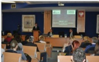
fol. UM Częstochowy

"Zarządzanie inteligentnym zasobem mieszkaniowym" było tematem konferencji naukowej, która odbyła się z w środę, 14 marca w częstochowskim magistracie.