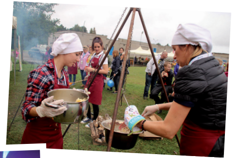
Podczas pikniku można było spróbować różnych smakołyków