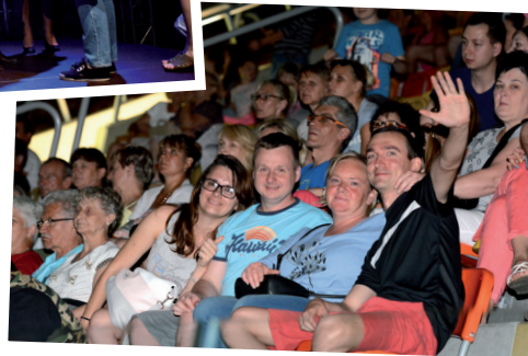
W Hali Sportowej Częstochowa zgromadziło się kilka tysięcy częstochowian