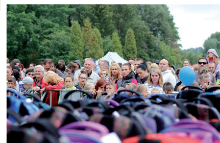
Mimo chłodnej aury, częstochowianie doskonale bawili się w Parku Lisiniec