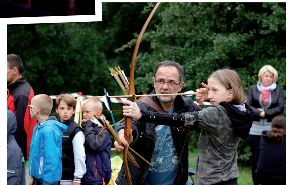
Moc atrakcji, także sportowych, dla dzieciaków