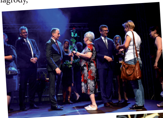
Gratulacje dla wyróżnionych