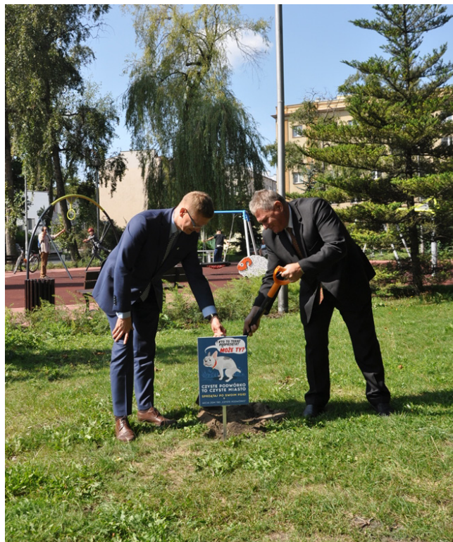
Inauguracja akcji „Czyste podwórko” na Skwerze Solidarności z udziałem prezydenta Krzysztofa Matyjaszczyka i prezesa ZGM TBS Pawła Koniecznego

Psie czy kocie nieczystości są dziś niemal wszędzie - na chodnikach, trawnikach, w piaskownicy.