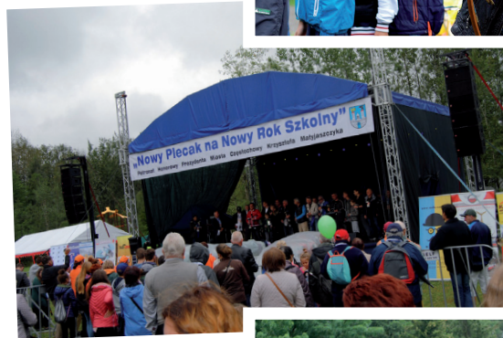
Akcja została zainaugurowana 16 lat temu