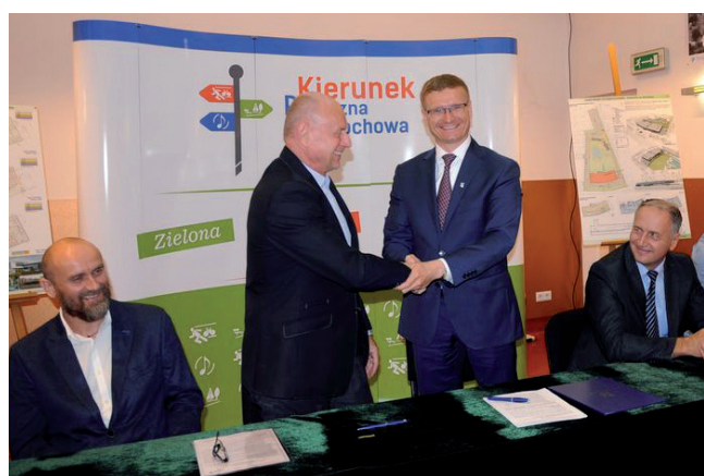
Podpisanie umowy na wykonanie Parku Wodnego

- Nie zdarzyło nam się zakończyć żadnej inwestycji po terminie. Chcemy, by projekt na Park Wodny powstał