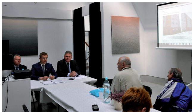
Inauguracja programu oddłużeniowego miała miejsce w częstochowskiej Konduktorowni

ZGM TBS cyklicznie przeprowadza także „Akcję udostępniania ofert pracy” najemcom lokali komunalnych i członkom ich rodzin oraz wszystkim osobom szukającym pracy. Tylko w pierwszej edycji tej akcji wzięło udział blisko 1700 lokatorów, którzy