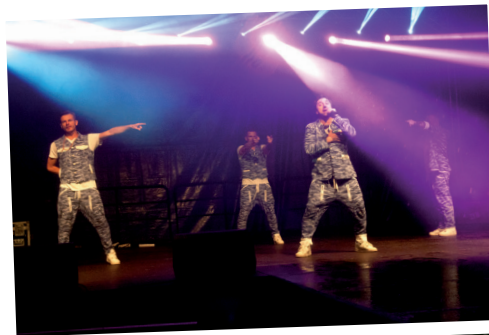
Gwiazda wieczoru zespół BOYS w akcji