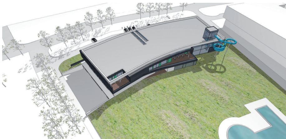
Park Wodny powstanie tuż obok odkrytego basenu

Program został podzielony na trzy obszary. Przyjazna Częstochowa - Aktywna to kierunek, związany