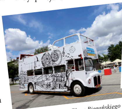
Start autobusu z Placu Biegańskiego