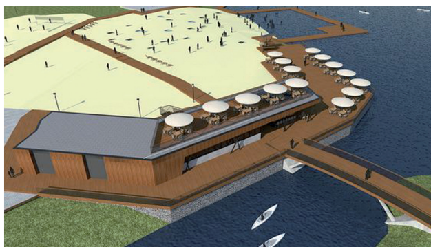
Lisiniec - strefa wypoczynku Adriatyk pawilon i plaża

Prace związane z plażą i kąpieliskiem mają zostać wykonane do 1 czerwca 2018 roku, natomiast cała inwestycja powinna zakończyć się do 15 października 2018 roku. W planach miasta jest także rewitalizacja otoczenia zbiornika Bałtyk.