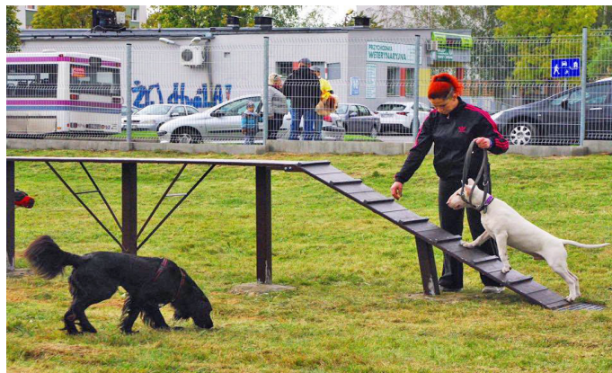
Wybieg dla psów w dzielnicy Północ

Pierwszy tego typu obiekt powstał w dzielnicy Północ. Wybieg znajduje się na jednej z parceli przy Lasku Aniołowskim. Teren o powierzchni około hektara został ogrodzony i wyposażony w zadaszenie dla właścicieli psów (przystanek), przeszkody dla psów, ławeczki, kosze na śmieci i podajniki na woreczki na odchody. Obiekt kosztował blisko 80 tys. zł.